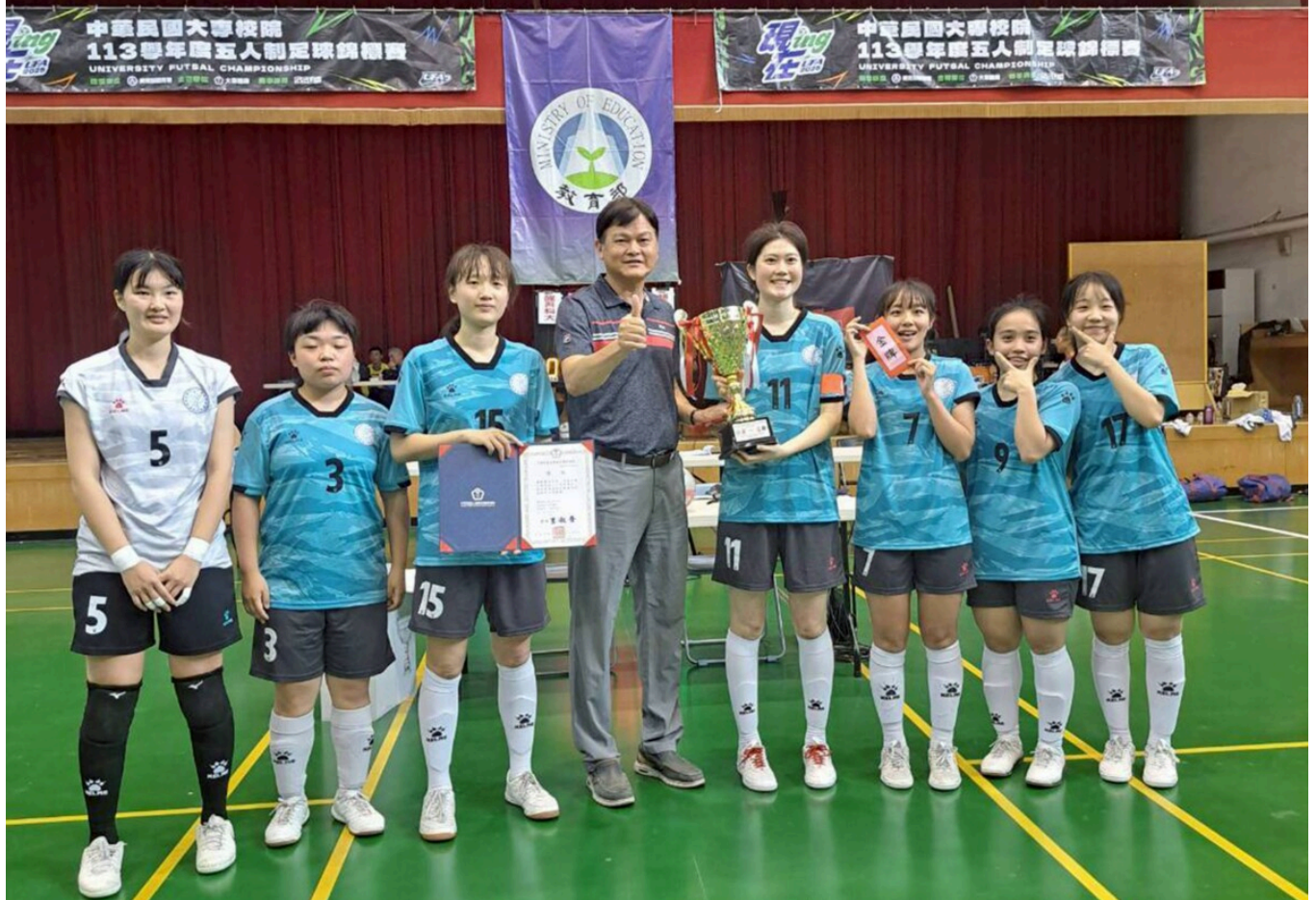
▲輔英科大女足校隊榮獲大專五人制足球錦標賽公開女生組冠軍及個人獎項，與林獻寵院長合影。

林惠賢指出，該校五人制女足隊成軍才四年，如今已連續二年拿到后冠，可喜可賀，尤其球員涵蓋護理系、物理治療系、資訊科技與管理系、應用外語系、休閒遊憩事業管理系等學生，個個學有專精，畢竟球員的運動生涯有限，若能加上專業技能傍身，未來職涯發展不可限量。